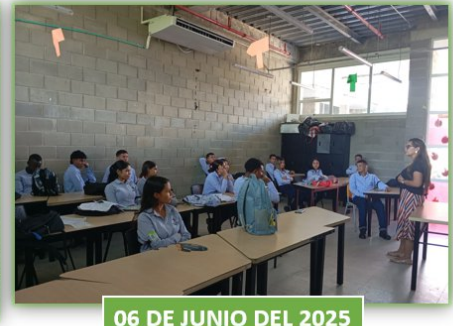
Ilustración 8. Apropiación del Reglamento -Nodos