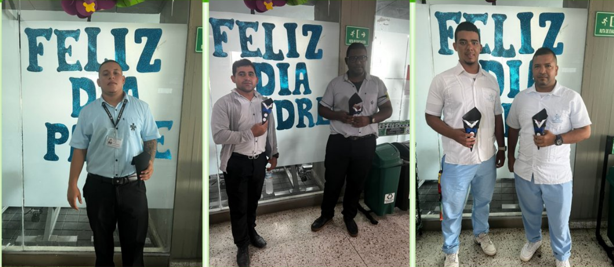
Ilustración 14 Día del padre - Centro comercio y Servicios.