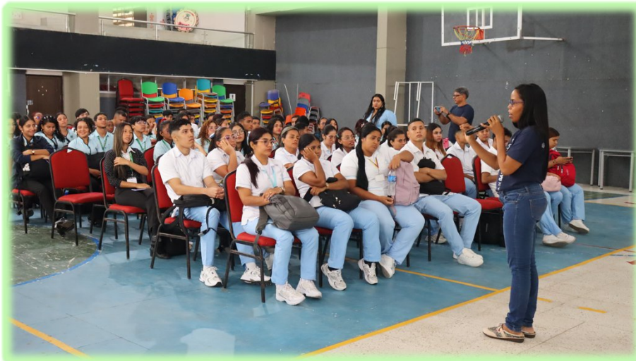
ACOGIDA II TRIMESTRE