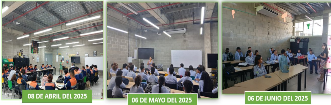
Ilustración 5. Fuente propia- Reglamento -Nodo logística