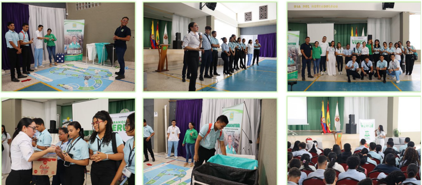
Ilustración 13. Fuente propia - Dia Mundial del Medio Ambiente - Auditorio Giacometto