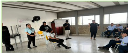
17 JUNIO TALLER : RESOLUCIÓN DE CONFLICTOS