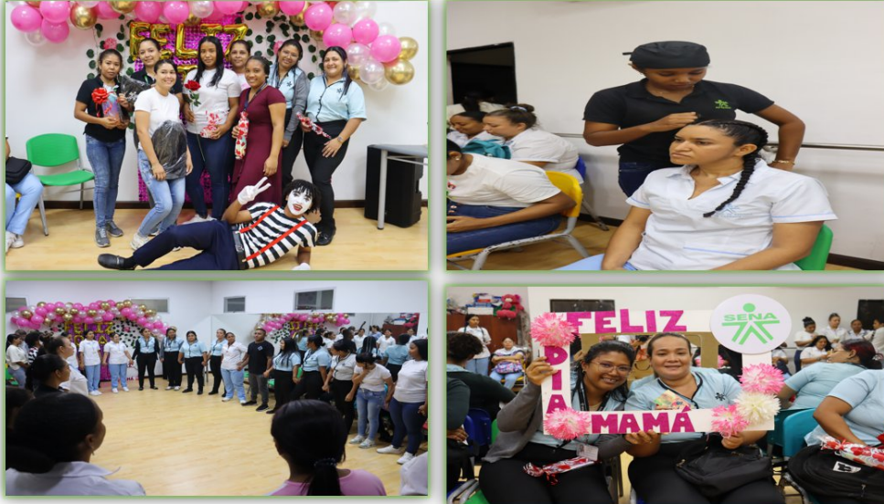
Ilustración 4. Fuente propia. Centro comercio y Servicios