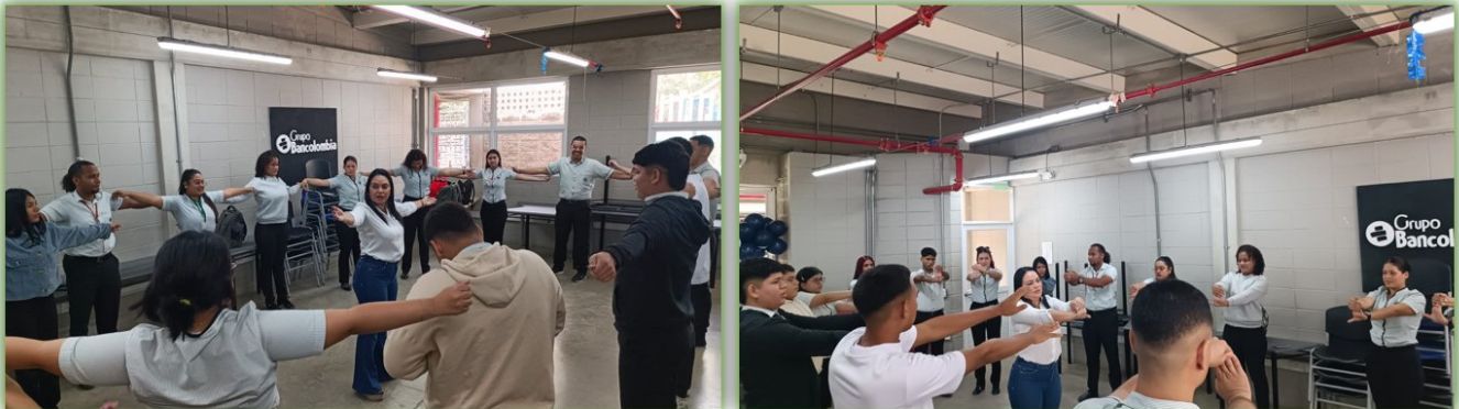
Ilustración 35. Taller de teatro- Nodos