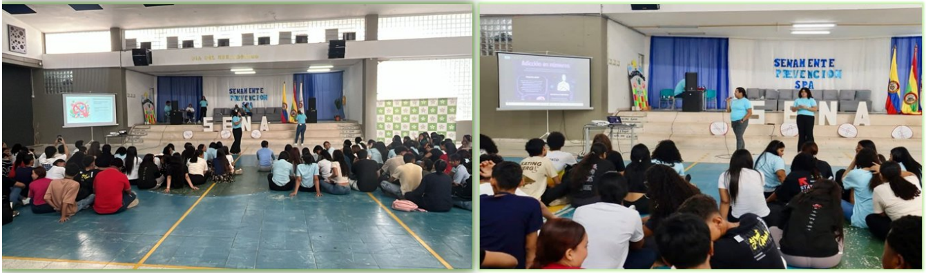
Ilustración 26. Senamente Auditorio Giacometto