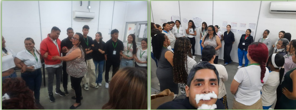
Ilustración 24. Fuente propia- Eslabón -Nodo Servicios Administrativos -