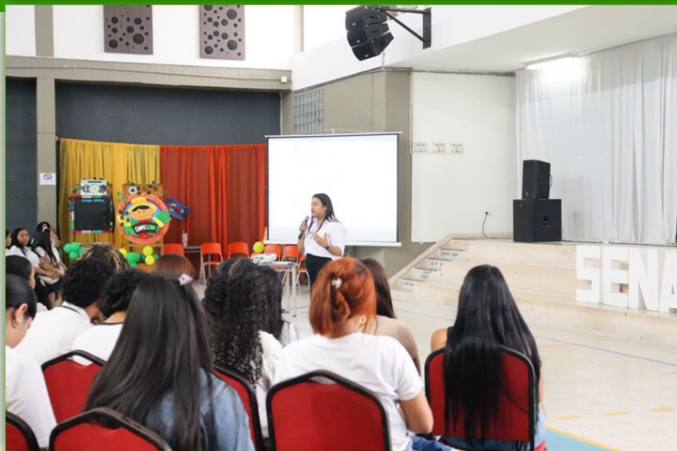
Ilustración 17. Socialización Póliza - Auditorio Giacometto