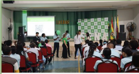
13 ABRIL TALLER : LA EMPATIA