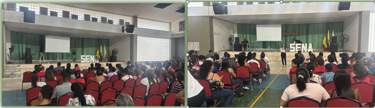
Ilustración 9. Fuente Propia - Escuela de Familia - Auditorio Giacometto