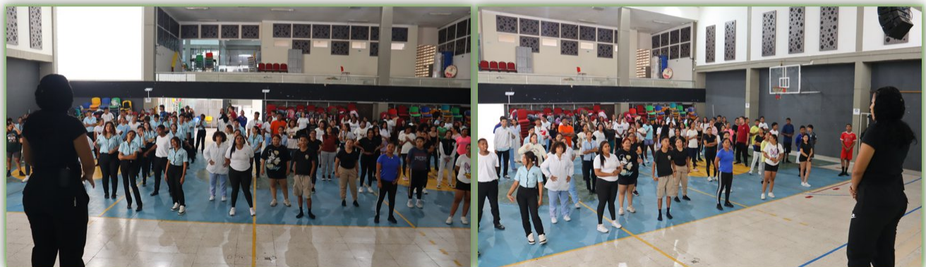
Ilustración 19. Estilo de vida saludable - Auditorio Giacometto