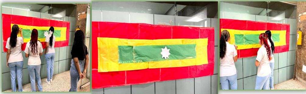
Ilustración 2. Centro Comercio y servicios