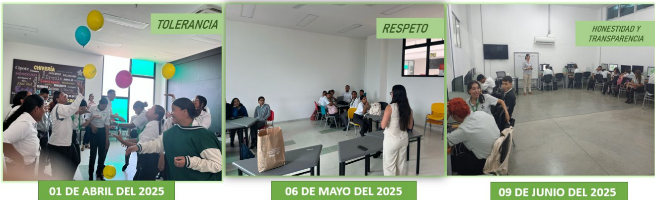
Ilustración 7. Fuente propia -Valor del Mes - Nodos