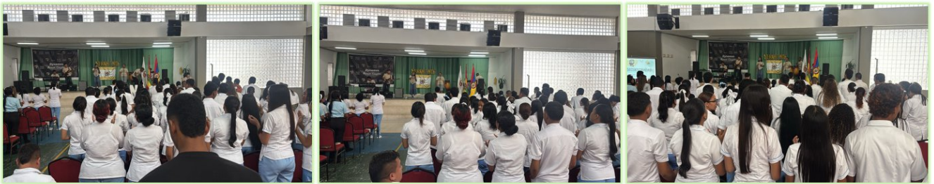
Ilustración 27. Senamente- Auditorio Giacometto