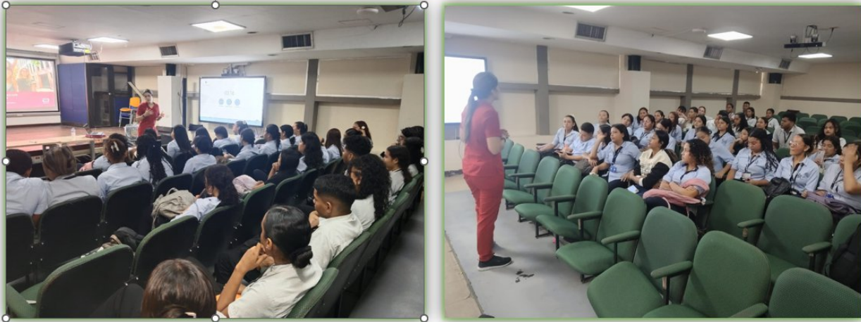
Ilustración 18. Educación sexual - Salón de audiovisuales