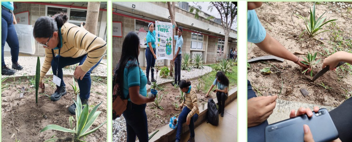
Ilustración 6. Día de la Tierra - Nodo Logística