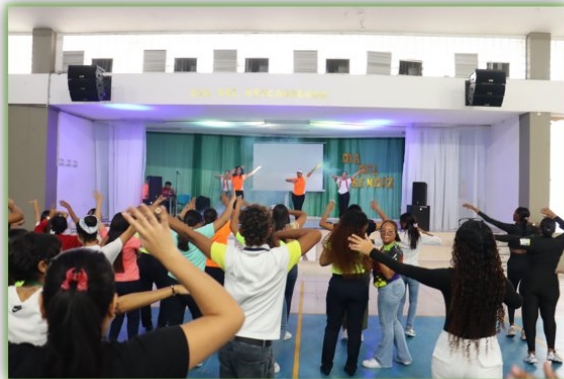
Ilustración 33. Dia del aprendiz - Auditorio Giacometto