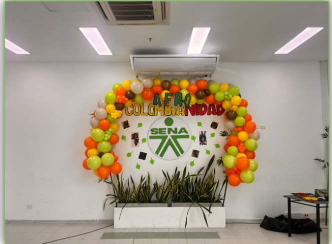
Ilustración 32. Evento cultural - Nodo Hotelaria