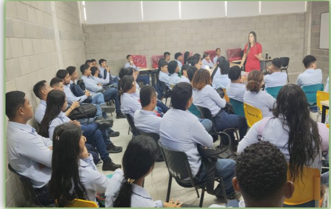
Ilustración 20. Responsabilidad Sexual -Nodos

4.3 Desarrollar habilidades blandas para la vida y el trabajo