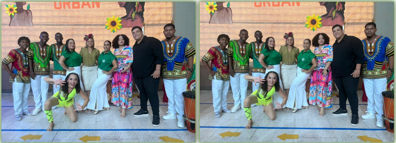
Ilustración 34. Semilleros Danza y Música