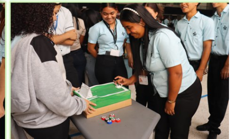
Ilustración 30. Estrategia Alimenta tu mente- Auditorio Giacometto