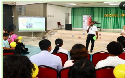
Ilustración 29. Enfoque Diferencial - Auditorio Giacometto