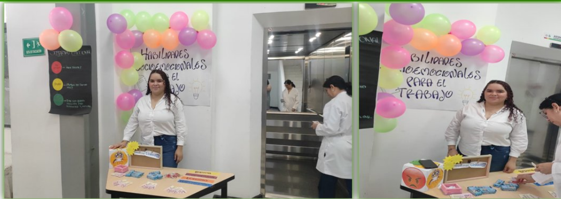
Ilustración 25. Taller de Motivación - Nodo de Comercialización