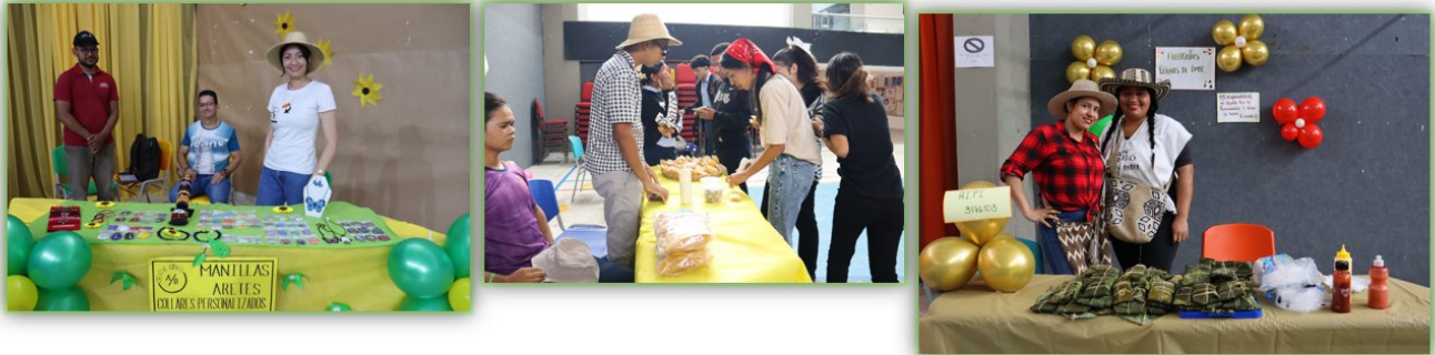
Ilustración 12. Feria Campesena- Auditorio Giacometto