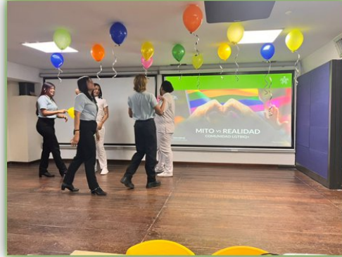
Ilustración 10. Conmemoración Orgullo LGTBI - Salón Audiovisuales