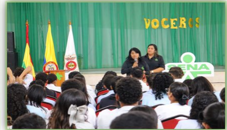
Ilustración 38. Elección Voceros - Auditorio Giacometto