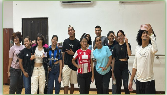
Ilustración 36. Audiciones - Salón de Danza

OBJETIVO ESTRATÉGICO 2: Generar escenarios de reconocimiento para aprendices en ejes de liderazgo, proyección social, formación y de talentos.